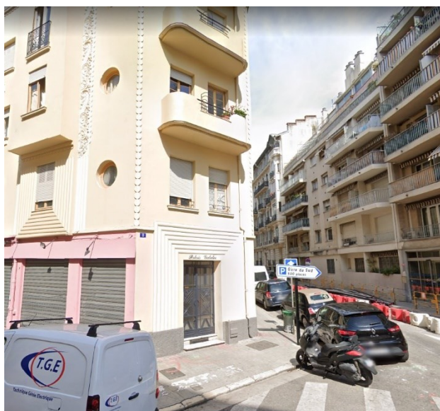
«Дом, в котором живет Сифр»

Да, он получил наше письмо с оригиналом протокола и переводом, так что его почтовый адрес у нас верный. У нас были в отношении этого определенные сомнения, так как из посольства мы получили адрес без номера квартиры – только название улицы и номер дома. А на фотографии по данному адресу расположен явно многоквартирный дом. Но! Оказалось, что номера дома и только фамилии адресата в Ницце достаточно 😊